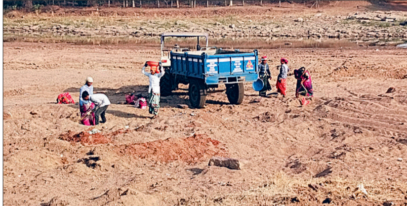
रेत का खनन और परिवहन किया जा रहा है।

जानकारी के अनुसार नगर से लगे करियाटोला, मटिया, बगदई, साल्हे और आसरा से रेत का बेरोकटोक खनन और परिवहन किया जा रहा है। इस आशय की शिकायतें राजस्व और खनिज विभाग में पहुंच रही हैं परन्तु अधिकारी दफ्तर से बाहर आकर कार्रवाई करने की हिम्मत नहीं जुटा पा रहे हैं। कहा जा रहा कि पंचायत और निकाय चुनाव के बाद बहुसंख्यक जनप्रतिनिधि रेत कारोबार में परोक्ष अपरोक्ष रूप लिप्त हो गए हैं। जनप्रतिनिधियों की संलिप्तता और निजी हित सभ्य के कारण खनिज और राजस्व विभाग के अधिकारी कार्रवाई करने से परहेज कर रहे हैं।